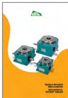
TAVOLE ROTANTI MECCANICHE MECHANICAL ROTARY TABLES