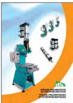
PRESSE PNEUMATICHE ED IDROPNEUMATICHE PNEUMATIC AND HYDROPNEUMATIC PRESSES