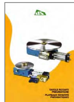
TAVOLE ROTANTI PNEUMATICHE PNEUMATIC ROTARY TABLES